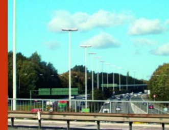
In 1935 begon men plannen voor een ring rond Brussel te smeden. Sinds 1974 is de Kaudenaardewijk totaal afgesneden van de Moortebeekwijk.

De familie De Viron verkavelde haar gronden in de Kaudenaardewijk en de andere grote eigenaars volgden. Tussen 1920 en 1930 bouwden rijke Brusselaars hier hun villa's. "In Dilbeek bouwen is geld uitzetten met verzekerde toekomst en tevens ook zijn eigen bestaan verfraaien in gezondheid en geluk" beloofde men toen. Voor de minder gegoede arbeiders werd in Moortebeek een tuinwijk aangelegd. Zeven architecten, o.a. Diongre en Brunfaut, bouwden op een oppervlakte van 20 hectaren op drie jaar tijd 360 woningen. De huizen worden nog steeds gemeenschappelijk onderhouden. De verzorgde tuintjes en de intussen 80-jarige bomen maken van deze wijk een oase in het drukke Anderlecht. Deze stadswandeling is een aanrader voor iedereen die van architectuur houdt.